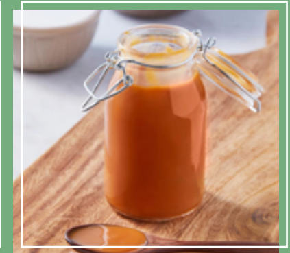
Dulce de leche sin lácteos. Leche condensada.