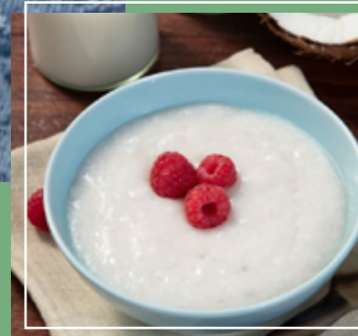
Yogur de coco vegano. Yogur de soja vegano.