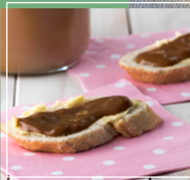
Dulce de leche.