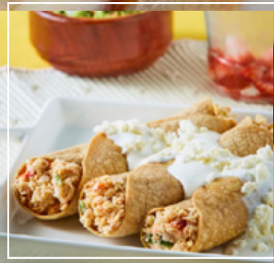
Tacos de pollo. Tortillas de trigo y fajitas de ternera.