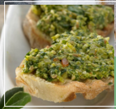
Bruschetta de aceitunas. Sopa de zanahorias y espárragos con almendras.