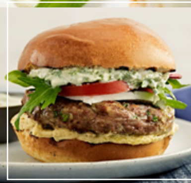
Hamburguesa de cordero mediterránea. Hamburguesa con cebolla, panceta y queso. Pan de hamburguesa.