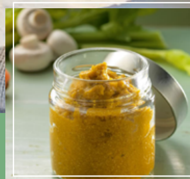
Concentrado de caldo de verduras.

Concentrado de caldo de verduras de aprovechamiento.