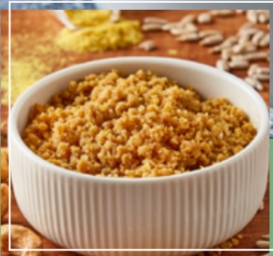
Queso parmesano vegano. Queso ricotta vegano.