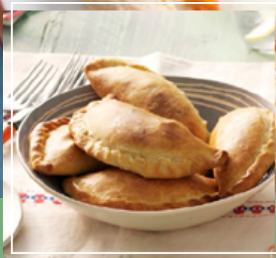
Empanadas de carne. Empanadas de pollo.