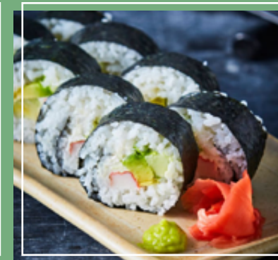
Sushi california. Poke bowl de atún.