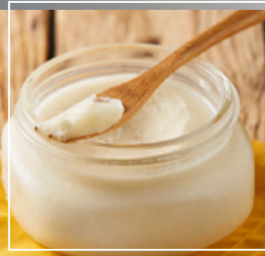
Manteca vegana. Crema vegana.