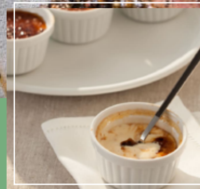
Creme brulee. Mousse de chocolate.