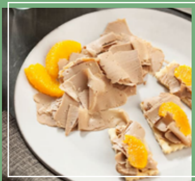
Paté de higaditos de pollo. Grisines.